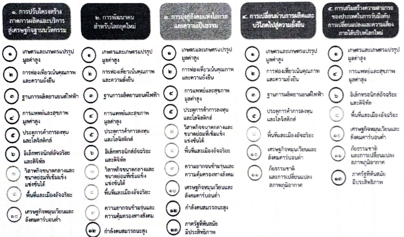
แผนภาพที่ ๓.๑ ความเชื่อมโยงระหว่างหมวดหมู่การพัฒนากับเป้าหมายหลัก

ความเชื่อมโยงระหว่างหมวดหมู่การพัฒนากับเป้าหมายหลักแสดงไว้ในแผนภาพที่ ๓.๑ โดยหมวดหมู่การพัฒนาที่กำหนดขึ้นเป็นประเด็นที่มีลักษณะเชิงบูรณาการที่ครอบคลุมการพัฒนาตั้งแต่ในระดับต้นน้ำจนถึงปลายน้ำ และสามารถนำไปสู่ผลพัฒนาทั้งในมิติเศรษฐกิจ สังคม ทรัพยากรธรรมชาติและสิ่งแวดล้อมไปพร้อมๆ กัน ทำให้หมวดหมู่แต่ละประการสามารถสนับสนุนเป้าหมายหลักได้มากกว่าหนึ่งข้อ นอกจากนี้ การพัฒนาภายใต้แต่ละหมวดหมู่ไม่ได้แยกขาดจากกัน แต่มีการสนับสนุนหรือเอื้อประโยชน์ซึ่งกันและกัน